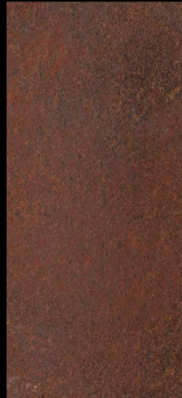
433 A KLONDIKE (LT. 1) + COLORÍ Col. 433 (6 ML.) KLONDIKE (LT. 2,5) + COLORÍ Col. 433 (15 ML.)