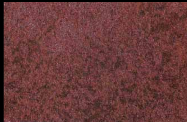
426 A + ADDITIVO SILVER G 200 KLONDIKE (LT. 1) + COLORÍ Col. 426 (6 ML.) + G 200 (LT. 0,100) KLONDIKE (LT. 2,5) + COLORÍ Col. 426 (15 ML.) + G 200 (LT. 0,250)