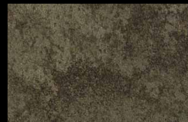
442 A + ADDITIVO GOLD G 100 KLONDIKE (LT. 1) + COLORÍ Col. 442 (6 ML.) + G 100 (LT. 0,100) KLONDIKE (LT. 2,5) + COLORÍ Col. 442 (15 ML.) + G 100 (LT. 0,250)