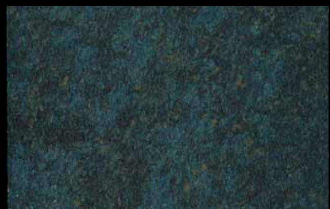
428 A + ADDITIVO GOLD G 100 KLONDIKE (LT. 1) + COLORI Col. 428 (6 ML.) + G 100 (LT. 0,100) KLONDIKE (LT. 2,5) + COLORI Col. 428 (15 ML.) + G 100 (LT. 0,250)