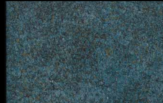
447 A + ADDITIVO SILVER G 200 KLONDIKE (LT. 1) + COLORI Col. 447 (6 ML.) + G 200 (LT. 0,100) KLONDIKE (LT. 2,5) + COLORI Col. 447 (15 ML.) + G 200 (LT. 0,250)