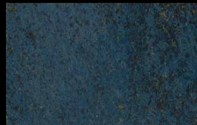
447 A KLONDIKE (LT. 1) + COLORI Col. 447 (6 ML.) KLONDIKE (LT. 2,5) + COLORI Col. 447 (15 ML.)