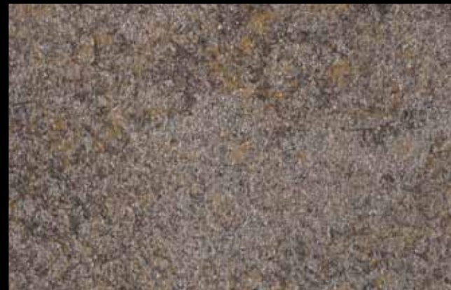
456 A + ADDITIVO SILVER G 200 KLONDIKE (LT. 1) + COLORÍ Col. 456 (6 ML.) + G 200 (LT. 0,100) KLONDIKE (LT. 2,5) + COLORÍ Col. 456 (15 ML.) + G 200 (LT. 0,250)