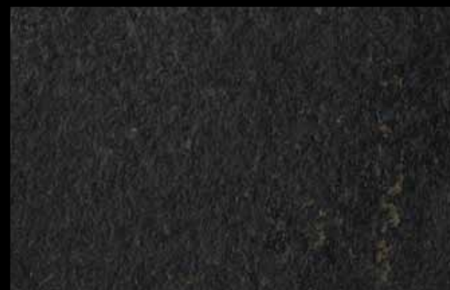
451 A KLONDIKE (LT. 1) + COLORÍ Col. 451 (6 ML.) KLONDIKE (LT. 2,5) + COLORÍ Col. 451 (15 ML.)