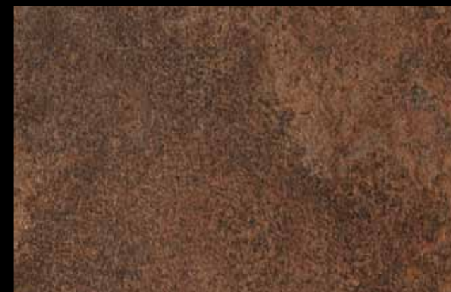
437 A + ADDITIVO GOLD G 100 KLONDIKE (LT. 1) + COLORÍ Col. 437 (6 ML.) + G 100 (LT. 0,100) KLONDIKE (LT. 2,5) + COLORÍ Col. 437 (15 ML.) + G 100 (LT. 0,250)