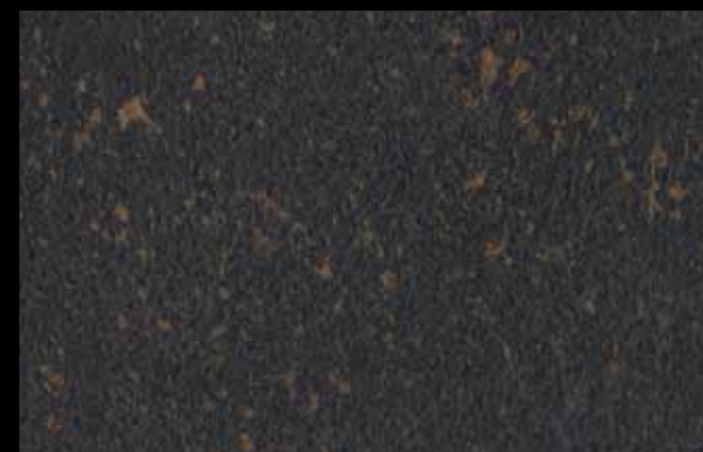
448 A KLONDIKE (LT. 1) + COLORÍ Col. 448 (6 ML.) KLONDIKE (LT. 2,5) + COLORÍ Col. 448 (15 ML.)