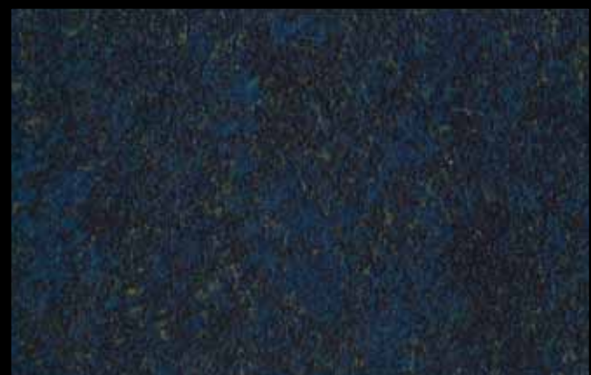
428 A KLONDIKE (LT. 1) + COLORI Col. 428 (6 ML.) KLONDIKE (LT. 2,5) + COLORI Col. 428 (15 ML.)