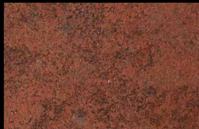
454 A + ADDITIVO GOLD G 100 KLONDIKE (LT. 1) + COLORÍ Col. 454 (6 ML.) + G 100 (LT. 0,100) KLONDIKE (LT. 2,5) + COLORÍ Col. 454 (15 ML.) + G 100 (LT. 0,250)