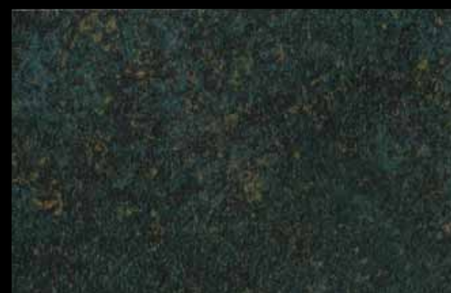
453 A KLONDIKE (LT. 1) + COLORÍ Col. 453 (6 ML.) KLONDIKE (LT. 2,5) + COLORÍ Col. 453 (15 ML.)