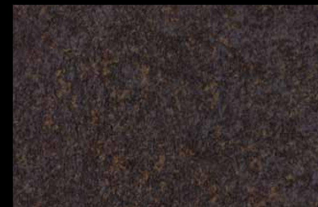
445 A KLONDIKE (LT. 1) + COLORÍ Col. 445 (6 ML.) KLONDIKE (LT. 2,5) + COLORÍ Col. 445 (15 ML.)