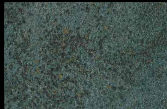
453 A + ADDITIVO SILVER G 200 KLONDIKE (LT. 1) + COLORÍ Col. 453 (6 ML.) + G 200 (LT. 0,100) KLONDIKE (LT. 2,5) + COLORÍ Col. 453 (15 ML.) + G 200 (LT. 0,250)