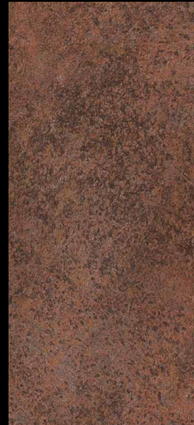
433 A + ADDITIVO SILVER G 200 KLONDIKE (LT. 1) + COLORÍ Col. 433 (6 ML.) + ADDITIVO SILVER G 200 (LT. 0,100) KLONDIKE (LT. 2,5) + COLORÍ Col. 433 (15 ML.) + ADDITIVO SILVER G 200 (LT. 0,250)