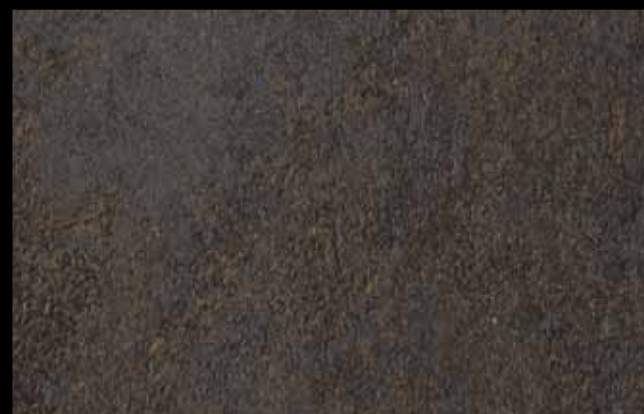
456 A KLONDIKE (LT. 1) + COLORÍ Col. 456 (6 ML.) KLONDIKE (LT. 2,5) + COLORÍ Col. 456 (15 ML.)