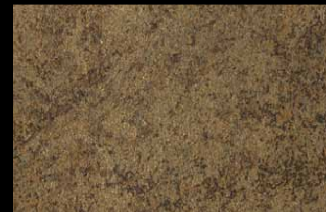
431 A + ADDITIVO GOLD G 100 KLONDIKE (LT. 1) + COLORÍ Col. 431 (6 ML.) + G 100 (LT. 0,100) KLONDIKE (LT. 2,5) + COLORÍ Col. 431 (15 ML.) + G 100 (LT. 0,250)