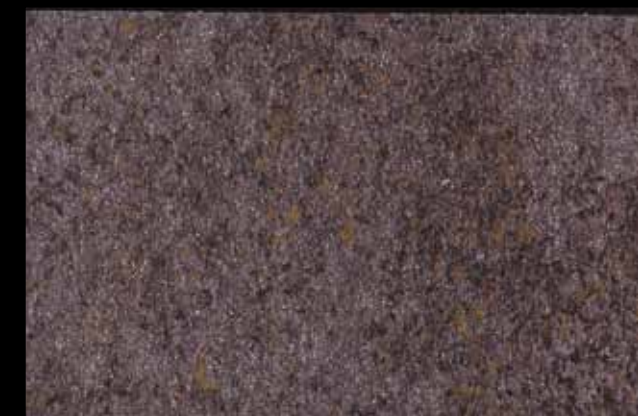
445 A + ADDITIVO SILVER G 200 KLONDIKE (LT. 1) + COLORÍ Col. 445 (6 ML.) + G 200 (LT. 0,100) KLONDIKE (LT. 2,5) + COLORÍ Col. 445 (15 ML.) + G 200 (LT. 0,250)