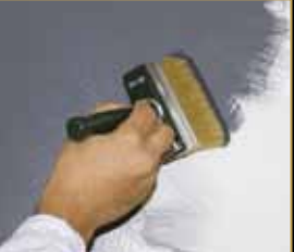
1) Primer 900