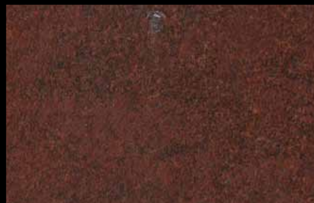
454 A KLONDIKE (LT. 1) + COLORÍ Col. 454 (6 ML.) KLONDIKE (LT. 2,5) + COLORÍ Col. 454 (15 ML.)