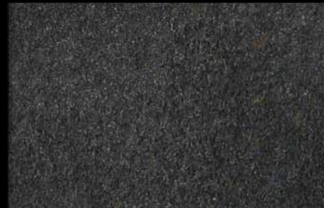
451 A + ADDITIVO SILVER G 200 KLONDIKE (LT. 1) + COLORÍ Col. 451 (6 ML.) + G 200 (LT. 0,100) KLONDIKE (LT. 2,5) + COLORÍ Col. 451 (15 ML.) + G 200 (LT. 0,250)