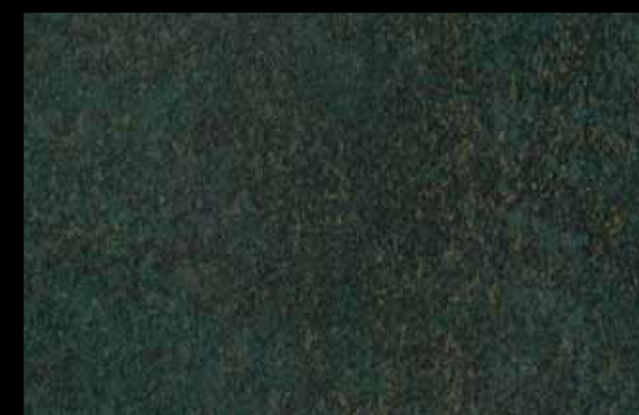
427 A KLONDIKE (LT. 1) + COLORÍ Col. 427 (6 ML.) KLONDIKE (LT. 2,5) + COLORÍ Col. 427 (15 ML.)