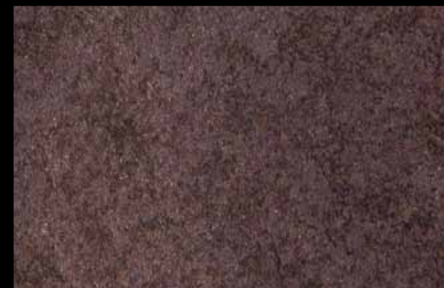
429 A + ADDITIVO GOLD G 100 KLONDIKE (LT. 1) + COLORÍ Col. 429 (6 ML.) + G 100 (LT. 0,100) KLONDIKE (LT. 2,5) + COLORÍ Col. 429 (15 ML.) + G 100 (LT. 0,250)