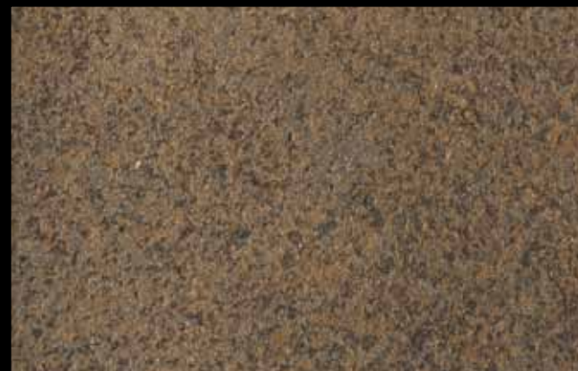
456 A + ADDITIVO GOLD G 100 KLONDIKE (LT. 1) + COLORÍ Col. 456 (6 ML.) + G 100 (LT. 0,100) KLONDIKE (LT. 2,5) + COLORÍ Col. 456 (15 ML.) + G 100 (LT. 0,250)