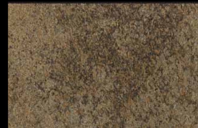
431 A + ADDITIVO SILVER G 200 KLONDIKE (LT. 1) + COLORÍ Col. 431 (6 ML.) + G 200 (LT. 0,100) KLONDIKE (LT. 2,5) + COLORÍ Col. 431 (15 ML.) + G 200 (LT. 0,250)