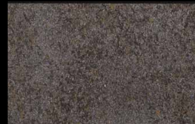
425 A + ADDITIVO SILVER G 200 KLONDIKE (LT. 1) + COLORI Col. 425 (6 ML.) + G 200 (LT. 0,100) KLONDIKE (LT. 2,5) + COLORI Col. 425 (15 ML.) + G 200 (LT. 0,250)