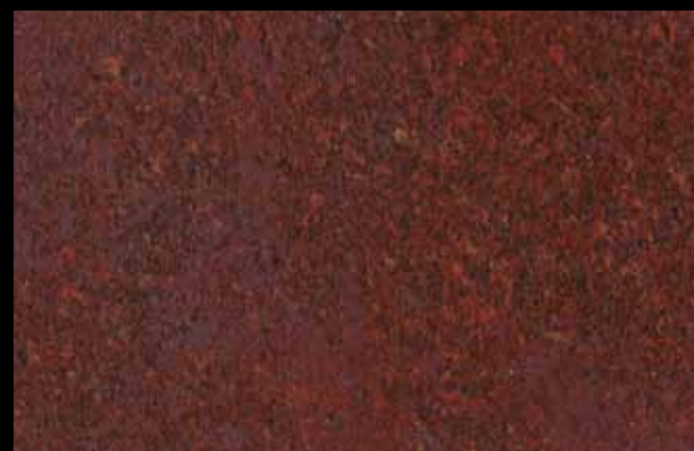
426 A KLONDIKE (LT. 1) + COLORÍ Col. 426 (6 ML.) KLONDIKE (LT. 2,5) + COLORÍ Col. 426 (15 ML.)