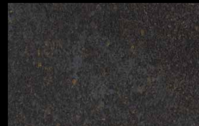
425 A KLONDIKE (LT. 1) + COLORI Col. 425 (6 ML.) KLONDIKE (LT. 2,5) + COLORI Col. 425 (15 ML.)