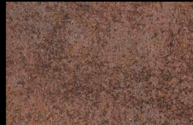
437 A + ADDITIVO SILVER G 200 KLONDIKE (LT. 1) + COLORÍ Col. 437 (6 ML.) + G 200 (LT. 0,100) KLONDIKE (LT. 2,5) + COLORÍ Col. 437 (15 ML.) + G 200 (LT. 0,250)