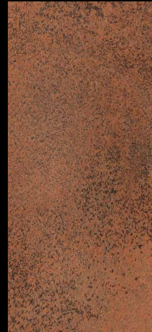
433 A + ADDITIVO GOLD G 100 KLONDIKE (LT. 1) + COLORÍ Col. 433 (6 ML.) + ADDITIVO GOLD G 100 (LT. 0,100) KLONDIKE (LT. 2,5) + COLORÍ Col. 433 (15 ML.) + ADDITIVO GOLD G 100 (LT. 0,250)