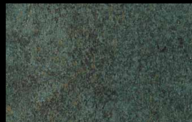
447 A + ADDITIVO GOLD G 100 KLONDIKE (LT. 1) + COLORI Col. 447 (6 ML.) + G 100 (LT. 0,100) KLONDIKE (LT. 2,5) + COLORI Col. 447 (15 ML.) + G 100 (LT. 0,250)