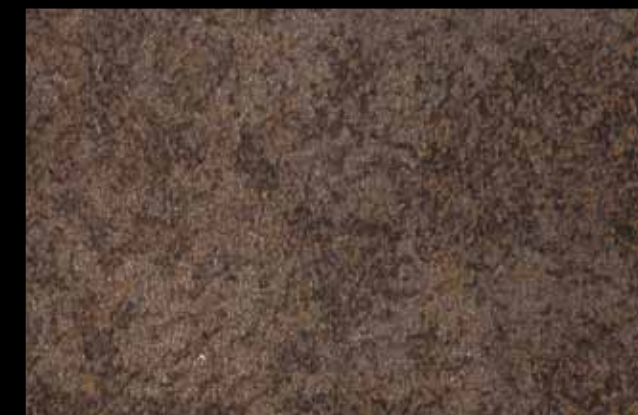
445 A + ADDITIVO GOLD G 100 KLONDIKE (LT. 1) + COLORÍ Col. 445 (6 ML.) + G 100 (LT. 0,100) KLONDIKE (LT. 2,5) + COLORÍ Col. 445 (15 ML.) + G 100 (LT. 0,250)