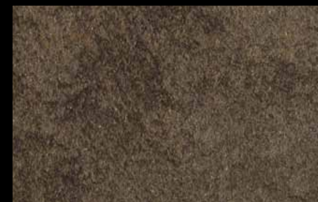
425 A + ADDITIVO GOLD G 100 KLONDIKE (LT. 1) + COLORI Col. 425 (6 ML.) + G 100 (LT. 0,100) KLONDIKE (LT. 2,5) + COLORI Col. 425 (15 ML.) + G 100 (LT. 0,250)