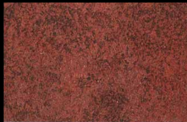
426 A + ADDITIVO GOLD G 100 KLONDIKE (LT. 1) + COLORÍ Col. 426 (6 ML.) + G 100 (LT. 0,100) KLONDIKE (LT. 2,5) + COLORÍ Col. 426 (15 ML.) + G 100 (LT. 0,250)