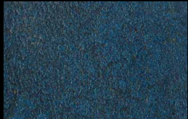
428 A + ADDITIVO SILVER G 200 KLONDIKE (LT. 1) + COLORI Col. 428 (6 ML.) + G 200 (LT. 0,100) KLONDIKE (LT. 2,5) + COLORI Col. 428 (15 ML.) + G 200 (LT. 0,250)