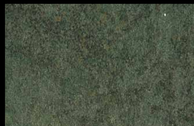
453 A + ADDITIVO GOLD G 100 KLONDIKE (LT. 1) + COLORÍ Col. 453 (6 ML.) + G 100 (LT. 0,100) KLONDIKE (LT. 2,5) + COLORÍ Col. 453 (15 ML.) + G 100 (LT. 0,250)