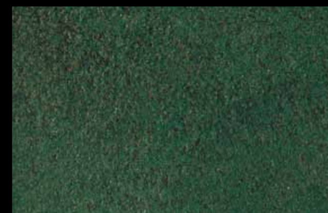
427 A + ADDITIVO GOLD G 100 KLONDIKE (LT. 1) + COLORÍ Col. 427 (6 ML.) + G 100 (LT. 0,100) KLONDIKE (LT. 2,5) + COLORÍ Col. 427 (15 ML.) + G 100 (LT. 0,250)