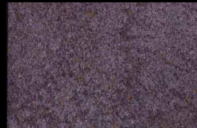
429 A + ADDITIVO SILVER G 200 KLONDIKE (LT. 1) + COLORÍ Col. 429 (6 ML.) + G 200 (LT. 0,100) KLONDIKE (LT. 2,5) + COLORÍ Col. 429 (15 ML.) + G 200 (LT. 0,250)