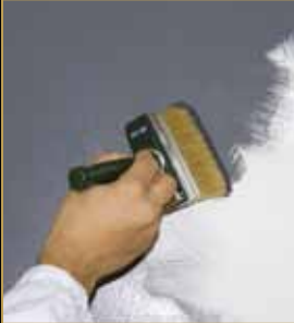
1) Primer 900