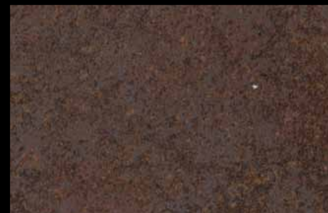
437 A KLONDIKE (LT. 1) + COLORÍ Col. 437 (6 ML.) KLONDIKE (LT. 2,5) + COLORÍ Col. 437 (15 ML.)