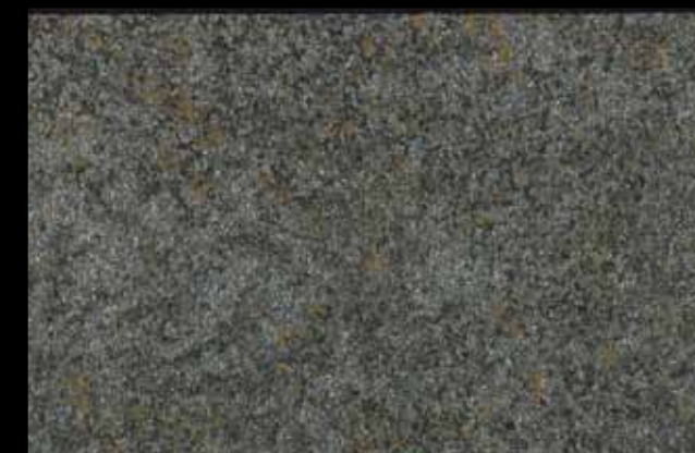
442 A + ADDITIVO SILVER G 200 KLONDIKE (LT. 1) + COLORÍ Col. 442 (6 ML.) + G 200 (LT. 0,100) KLONDIKE (LT. 2,5) + COLORÍ Col. 442 (15 ML.) + G 200 (LT. 0,250)