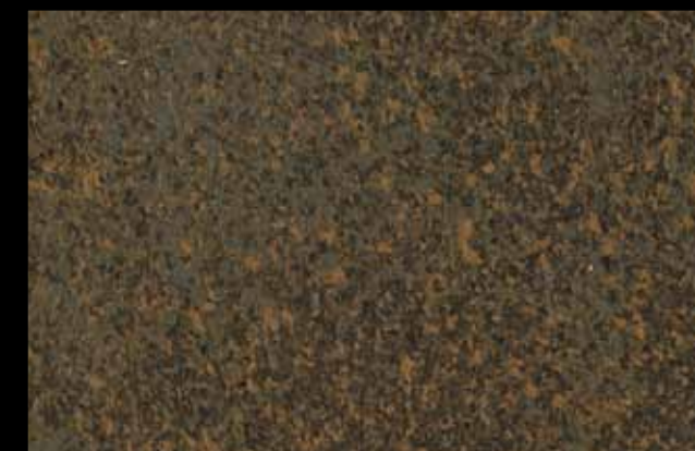
431 A KLONDIKE (LT. 1) + COLORÍ Col. 431 (6 ML.) KLONDIKE (LT. 2,5) + COLORÍ Col. 431 (15 ML.)