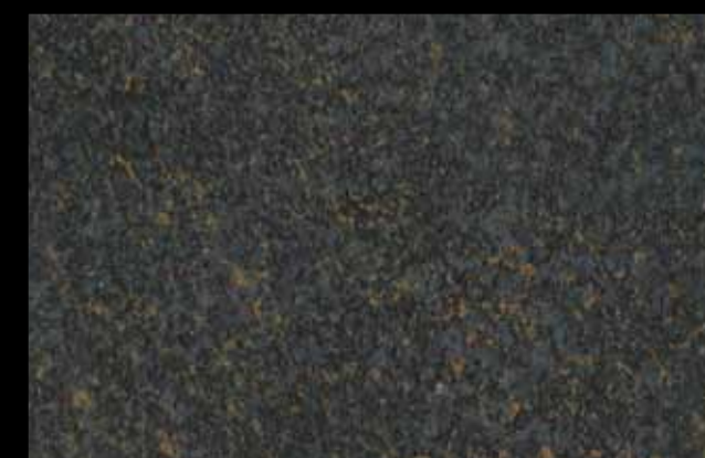
442 A KLONDIKE (LT. 1) + COLORÍ Col. 442 (6 ML.) KLONDIKE (LT. 2,5) + COLORÍ Col. 442 (15 ML.)