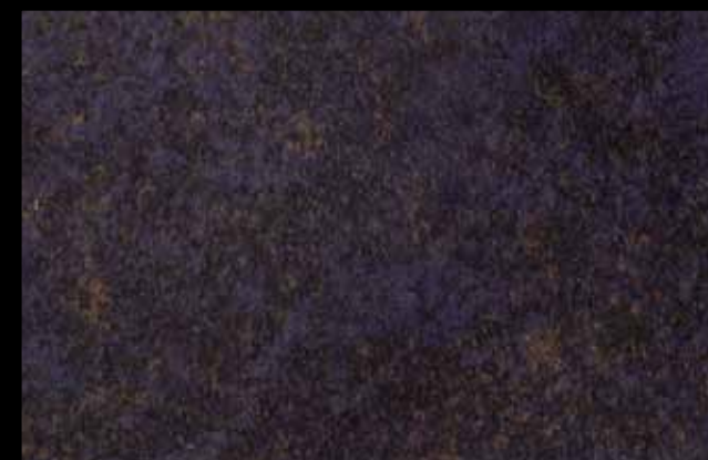
429 A KLONDIKE (LT. 1) + COLORÍ Col. 429 (6 ML.) KLONDIKE (LT. 2,5) + COLORÍ Col. 429 (15 ML.)