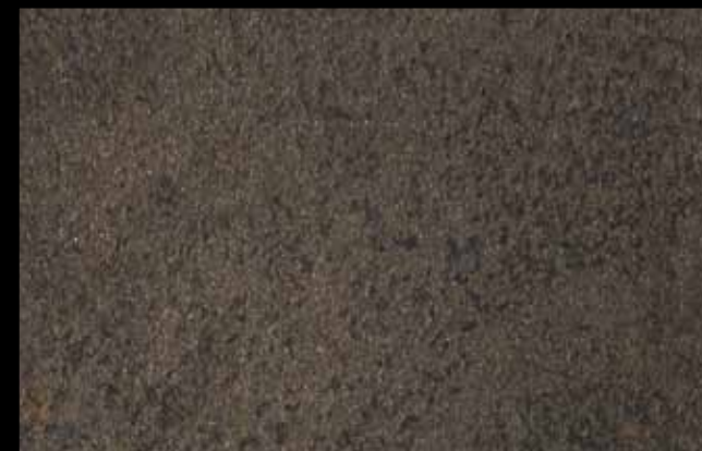
448 A + ADDITIVO GOLD G 100 KLONDIKE (LT. 1) + COLORÍ Col. 448 (6 ML.) + G 100 (LT. 0,100) KLONDIKE (LT. 2,5) + COLORÍ Col. 448 (15 ML.) + G 100 (LT. 0,250)