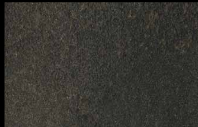
451 A + ADDITIVO GOLD G 100 KLONDIKE (LT. 1) + COLORÍ Col. 451 (6 ML.) + G 100 (LT. 0,100) KLONDIKE (LT. 2,5) + COLORÍ Col. 451 (15 ML.) + G 100 (LT. 0,250)