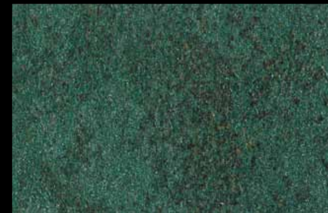
427 A + ADDITIVO SILVER G 200 KLONDIKE (LT. 1) + COLORÍ Col. 427 (6 ML.) + G 200 (LT. 0,100) KLONDIKE (LT. 2,5) + COLORÍ Col. 427 (15 ML.) + G 200 (LT. 0,250)