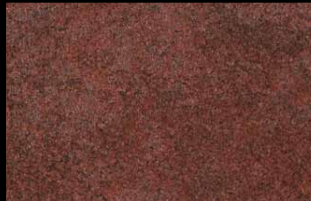
454 A + ADDITIVO SILVER G 200 KLONDIKE (LT. 1) + COLORÍ Col. 454 (6 ML.) + G 200 (LT. 0,100) KLONDIKE (LT. 2,5) + COLORÍ Col. 454 (15 ML.) + G 200 (LT. 0,250)