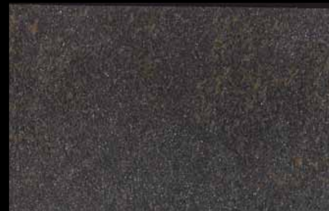
448 A + ADDITIVO SILVER G 200 KLONDIKE (LT. 1) + COLORÍ Col. 448 (6 ML.) + G 200 (LT. 0,100) KLONDIKE (LT. 2,5) + COLORÍ Col. 448 (15 ML.) + G 200 (LT. 0,250)